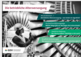
Die betriebliche Altersversorgung