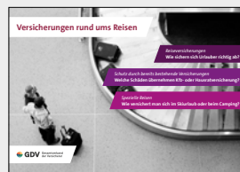
Versicherungen rund ums Reisen