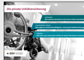
Die private Unfallversicherung