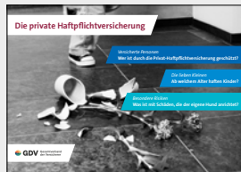
Die private Haftpflichtversicherung