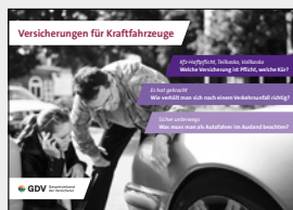
Versicherungen für Kraftfahrzeuge