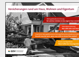
Versicherungen rund um Haus, Wohnen und Eigentum