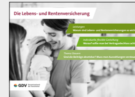
Die Lebens- und Rentenversicherung