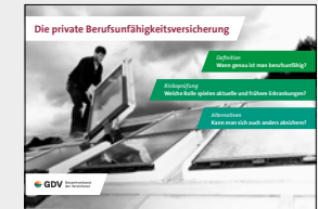
Die private Berufsunfähigkeitsversicherung